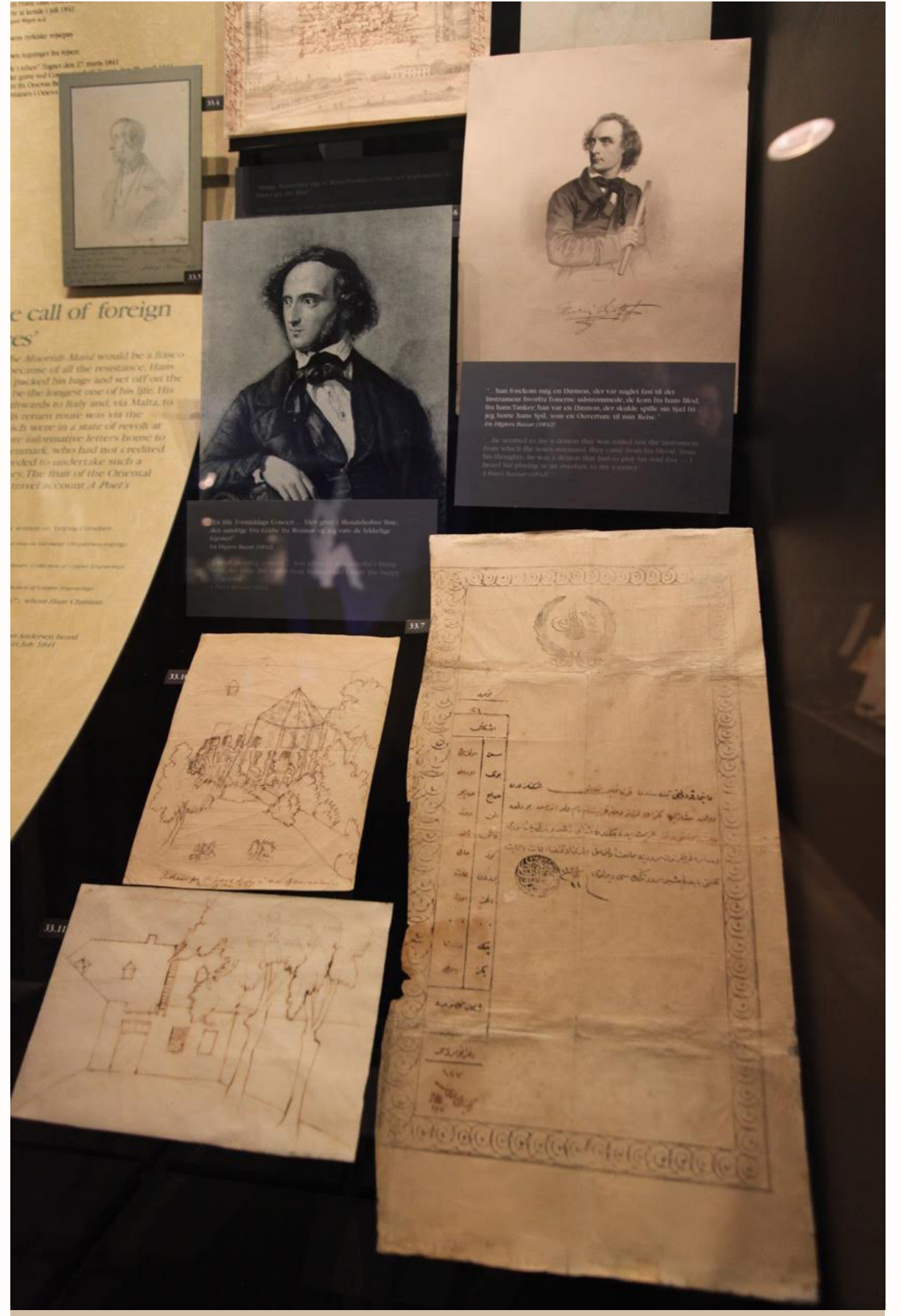
Andersen'in Osmanlı'dan aldığı vize müzede yer alıyor.

1831'den itibaren Avrupa'da sık sık seyahate çıkmaya başlayan Hans Christian Andersen, bütün hayatı boyunca fırsat buldukça seyahat eder. Seyahatlerinde elde ettiği bilgiler ve gözlemleriyle Andersen, İsveç, İspanya, İtalya, Portekiz ve Ortadoğu hakkında kısa öyküler yazar. Seyahatleri sırasında Paris'te Victor Hugo, Heinrich Heine, Balzac ve Alexandre Dumas gibi yazarlarla tanışır.